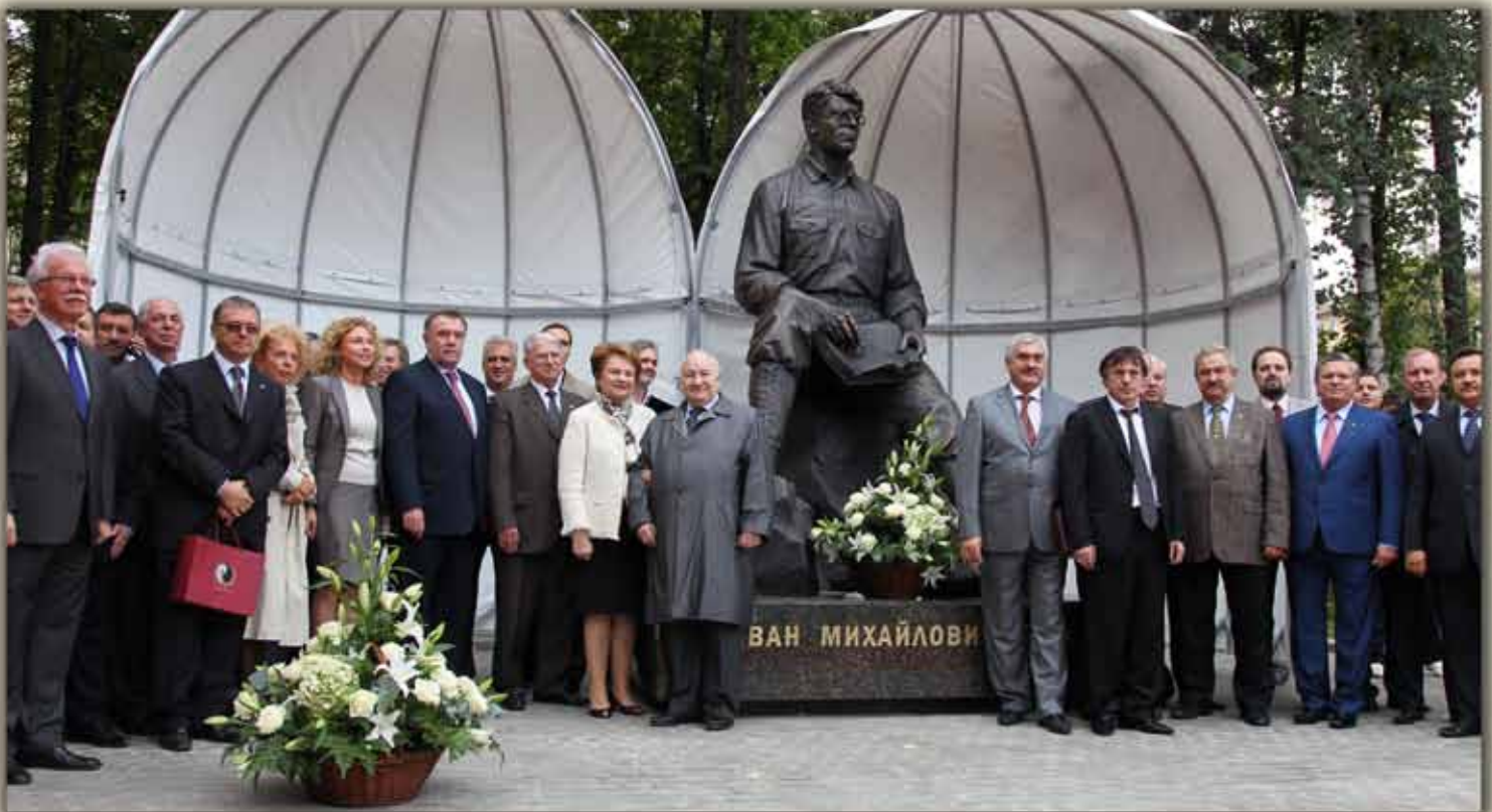
Благотворители университета у памятника академику И.М. Губкину 21 сентября 2011 года в день 140-летия со дня его рождения.