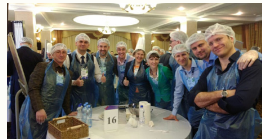
Шуточный кулинарный конкурс

В целом конкурс безусловно ценен и полезен как для страны, так и для участников. Многие победители прошлого года получили назначения на различные высокопоставленные посты в государственных органах: к примеру, в Минэнерго один победитель конкурса 2017 года стал заместителем министра, второй – начальником департамента.