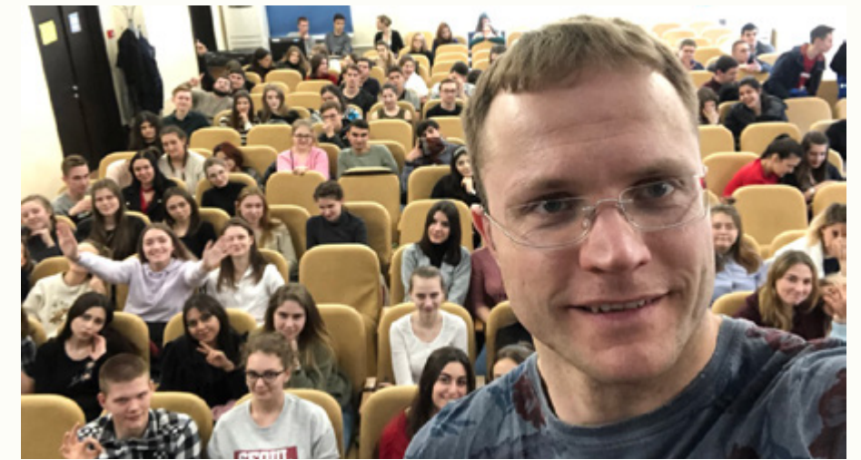
Социальный проект: встреча со старшеклассниками

В течение двух дней мы работали в командах по 10 человек, решая самые различные групповые задания: от бизнес кейсов и законодательства до социальных задач и международных отношений. За 2 дня мы поработали в 3-х разных командах, и каждый раз к нам был приставлен оценщик, который по заданным критериям и методологии ставил каждому из нас баллы, по сумме которых определялись финалисты.