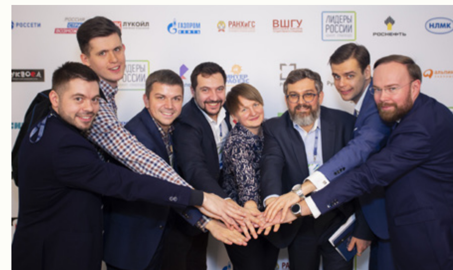
Лидеры России 2019 года

Вместе с коллегами из Инжинирингового дивизиона и Госкорпорации «Росатом» мы запустили социальный проект «Новая жизнь», направленный на помощь больным раком крови. Почему это важно? Вот цифры: каждые 20 минут кто-то в нашей стране заболевает раком крови. В России почти 350 тысяч подобных больных. Значитель-