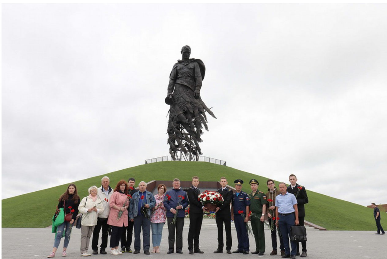
Делегация Губкинского университета у Ржевского мемориала Советскому солдату, 8 июля 2020 года